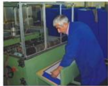
Dış Kaplama Üretim Hattı: Sıcak veya soğuk tutkal ile cilt bezi mukavaya lamine edilir. Günlük üretim kapasitesi 21.000 adettir.