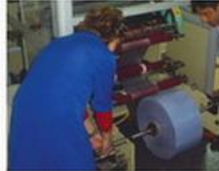
Etiketleme: Klasörlerin sırtlarına etiket işlemi uygulanarak pvc etiket cebi lamine edilirken etiketler de otomatik olarak takılır. Günlük üretim kapasitesi 21.000 adettir.