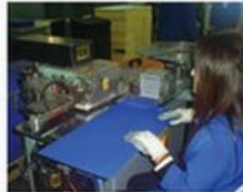
Köşe Koruma Üretim Hattı: Köşe koruyucu metaler klasörlerin kenarlarına çakılır. Günlük üretim kapasitesi 22.000 adettir.